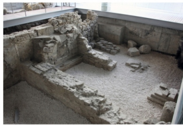
Vestiges archéologiques de l'époque romaine. Casa de la Juventud

Nous grimpons à présent la côte de la butte du château, où nous pouvons observer le reste des fortifications anciennes, comprenant aujourd'hui des parties de murs et une tour près de la Puerta de Jerez. Sur l'esplanade s'élève l'ermitage de la patronne de Lebrija, la Virgen del Castillo , qui date du XIV e siècle.